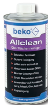
Allclean Oberflächenreiniger Art.-Nr. 266 120 0500