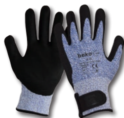
Arbeitsschutzhand- schuh - cut - Art.-Nr. 905 020 2xx