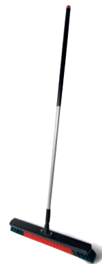
Werkstattbesen Art.-Nr. PZ-110-665 Aluminiumstiel Art.-Nr. PZ-140-1505