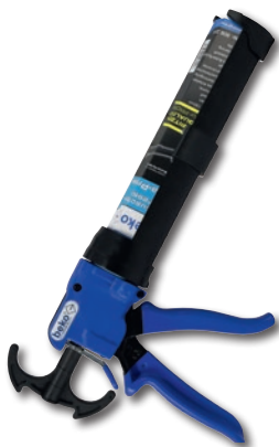
Kartuschenpresse Ultra-Press Art.-Nr. 906 3310