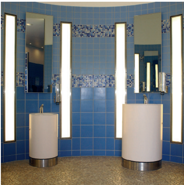
Variables Leistungsspektrum – für alle Fugenbreiten und alle keramischen Beläge.

4 Nach dem Abtrocknen den verbleibenden Mörtelschleier mit einem leicht feuchten Schwamm entfernen.