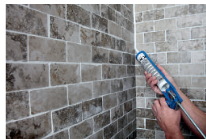
Durch den Einsatz von PCI Carraferm entstehen keine Randzonenverfärbungen bei Naturwerksteinen.