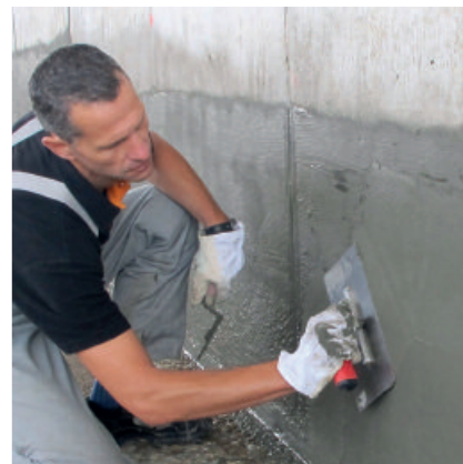
PCI Barraseal ist plastisch-geschmeidig. Poren und Vertiefungen werden leicht und schnell geschlossen.