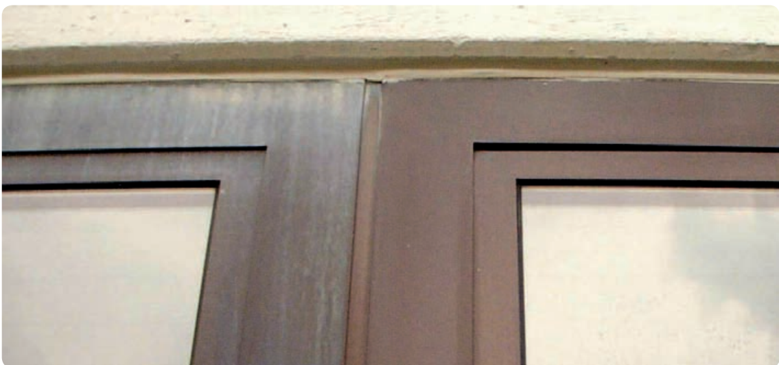
Rapid entfernt Farbe von Regenauswaschung