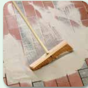
... vollständig füllen