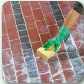
Reste mit feuchtem Schwamm aufnehmen