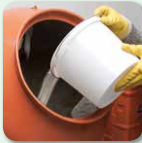
max. 2 l Wasser vorlegen