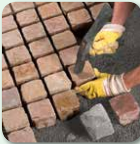
Pflaster hammerfest setzen