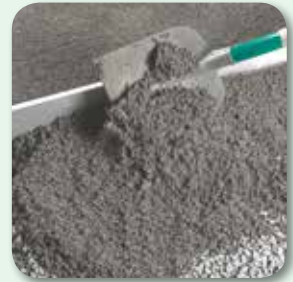
Mörtel aufbringen und über Lehren abziehen