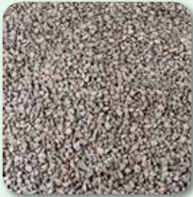
Unterbau und Tragschichten vorbereiten