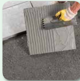
bei Platten unterseitig Haftschlämme auftragen