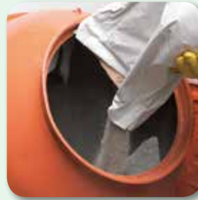
vbw 490 hinzufügen